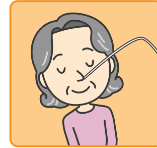
痰吸引(かくたんきゅういん)